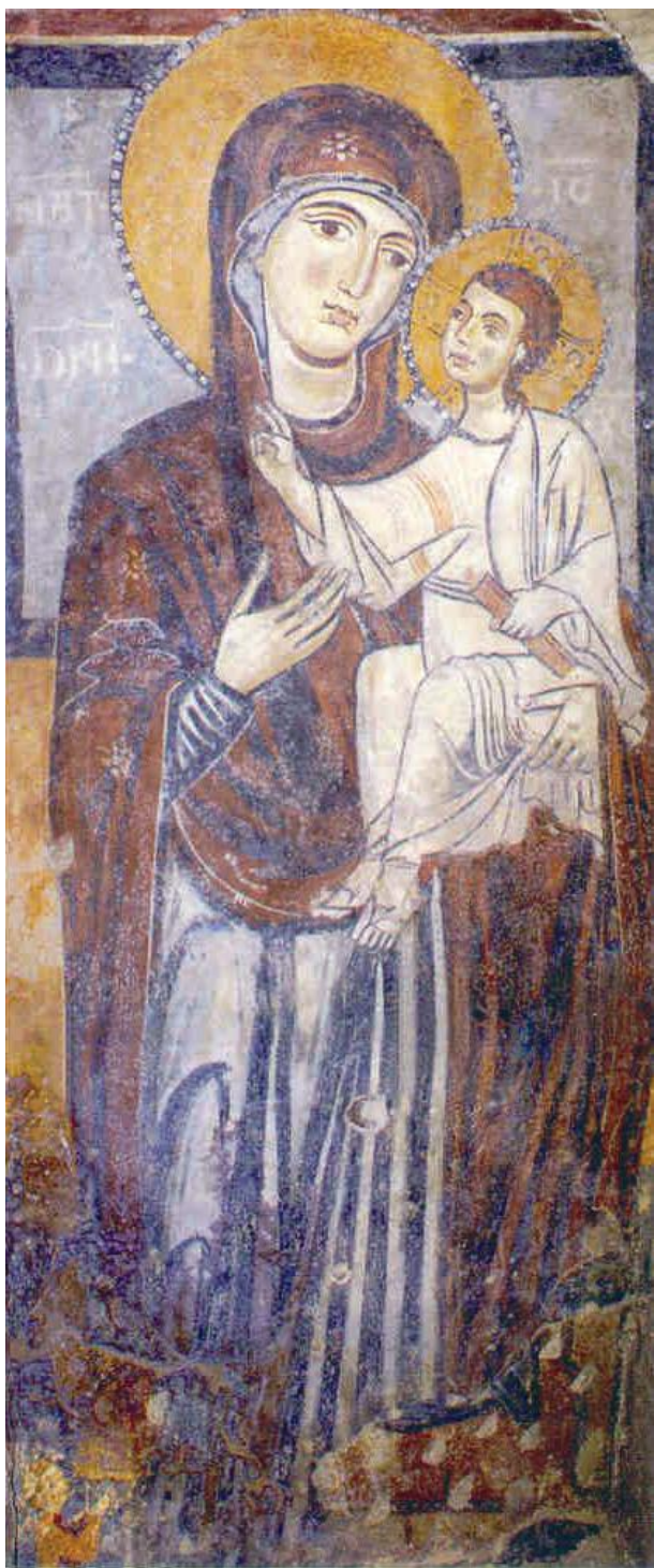
Fig. 5 - Mater Domini, Laterza

cescani, vedevano nel sorriso una nuova opportunità di evangelizzazione, rivolgendosi al popolo delle campagne e delle città, agli umili e ai potenti, con un linguaggio nuovo, attento ad evitare le arguzie teologiche, utilizzando persino il “riso” come una nuova opportunità di predicazione del Vangelo, che si allontanava dalla tradizionale visione di un “catechismo della paura” (Moretti 2001, p.44). Gli uomini del Medioevo, spesso si comportavano in modo diverso dai precetti degli uomini di chiesa, che generalmente vedevano nel riso e nel sorriso la tentazione del diavolo. Lo stesso San Luigi re di Francia, secondo le testimonianze di Joinville, rideva e talvolta di gusto (Le