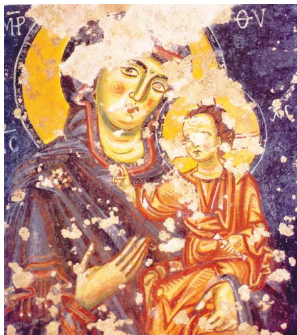
Fig. 6 - Chiesa rupestre di Sant'Andrea, Palagianello

cescani, vedevano nel sorriso una nuova opportunità di evangelizzazione, rivolgendosi al popolo delle campagne e delle città, agli umili e ai potenti, con un linguaggio nuovo, attento ad evitare le arguzie teologiche, utilizzando persino il “riso” come una nuova opportunità di predicazione del Vangelo, che si allontanava dalla tradizionale visione di un “catechismo della paura” (Moretti 2001, p.44). Gli uomini del Medioevo, spesso si comportavano in modo diverso dai precetti degli uomini di chiesa, che generalmente vedevano nel riso e nel sorriso la tentazione del diavolo. Lo stesso San Luigi re di Francia, secondo le testimonianze di Joinville, rideva e talvolta di gusto (Le