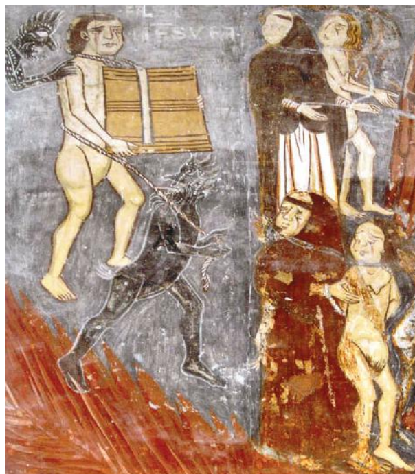
Fig. 8 - Matera, Cattedrale, Rinaldo da Taranto (attribuito), particolare del Giudizio Universale

CURZI, Santa Maria del Casale a Brindisi. Arte, politica e culto nel Salento angioino , Roma, 2013, p. 47. FALLA CASTELFRANCHI, Pittura monumentale bizantina in Puglia , Milano 1991, pp. 163-164. GATTINI, La cattedrale illustrata, per Nozze Teresa Gattini -Ettore Vietti. Matera XXVI aprile MCMXIII , Matera 1913. GRELLE - IUSCO, Arte in Basilicata (con note di aggiornamento alla edizione del 1981) Roma 2001. LE GOFF J., San Luigi , Torino 1996, pp. 396 - 402. MÉNARD, Le rire et le sourire dans le Roman courtois en France au Moyen Âge (1150 -1250) , Geneve 1969, pp. 23 -28. MORETTI., La ragione del sorriso e del riso nel medioevo , Bari, 2001, p. 44. MUSCOLINO, Matera. Cattedrale della Madonna della Bruna , in "Bollettino d'Arte", n. 29, 1985, pp. 127 - 133, in part. p. 130. NOVIELLO, Storiografia dell'arte pittorica popolare in Lucania e nella Basilicata: cultura figurativa popolare . Front Cover. Franco Noviello. Osanna Venosa, 1985, p.448. PACE, Circolazione e ricezione delle icone bizantine: i casi di Andria, Matera e Damasco , in AA. VV., Studi in onore di Michele D'Elia. Archeologia, Arte, Restauro e Tutela Archivistica , a cura di C. GELAO, Matera 1996, pp. 157 -165, in part. pp. 160.161 USPENSKIJ -LOSSKIJ, Il senso delle icone , Milano, 2007, pp. 88-89.