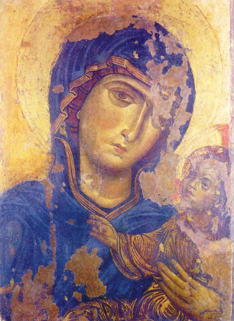
Fig. 2 - Madonna di Andria, icona lignea

la, naso sottile, sopracciglia distanziate dagli occhi. I capelli corti e lisci sulla fronte, diventano mossi sulla nuca con quattro riccioloni tondi e una ciocca che scende lungo il collo. Indossa una tunica manicata in rosa, clavata in azzurro, coperta da un mantello rosso. La veste in più parti è abbellita da quattro punti in bianco, come di perle, mentre la fascia azzurra in basso presenta le tracce di colore bianco di una decorazione a rombi con all'interno una perla.