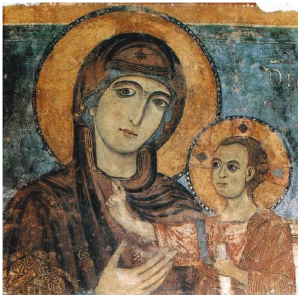
Fig. 1 - Matera, Cattedrale. Affresco della Madonna della Bruna

L'icona è in buono stato di conservazione, sono ancora visibili le tracce di una fascia rossa e di una più piccola gialla, delimitata da un filo di colore bianco. Lo sfondo è celeste. L'indizio di parte della spalliera indica che la Madonna in origine era seduta in trono, e dunque doveva pre-