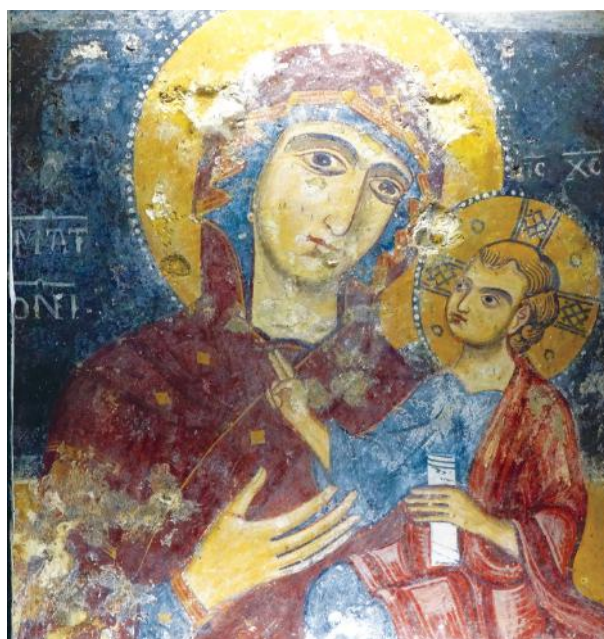
Fig. 4 - Madonna della Palomba, Matera

Mi permetterà il lettore una riflessione che nasce dal particolare, appena citato, di un accenno di sorriso nella nostra icona, in quanto è un chiaro segno della sua modernità. Gli ordini mendicanti dei domenicani e dei fran-